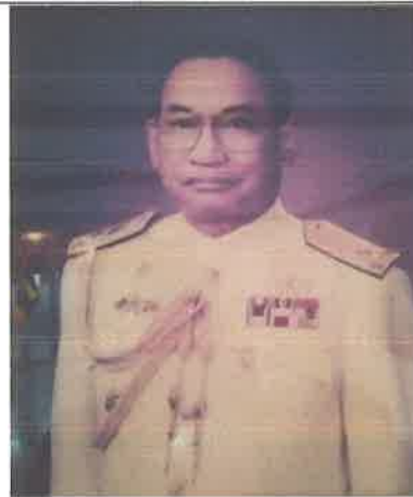
พล.ร.ท.วิจิตร ปาลกะวงษ์ ณ อยุธยา ๑ ต.ค.๓๙ ถึง ๓๐ ก.ย.๔๐