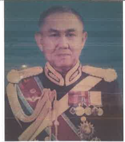
พล.ร.ท.สุนันท์ พัฒนวงศ์ ๑ ต.ค.๓๗ ถึง ๓๐ ก.ย.๓๘