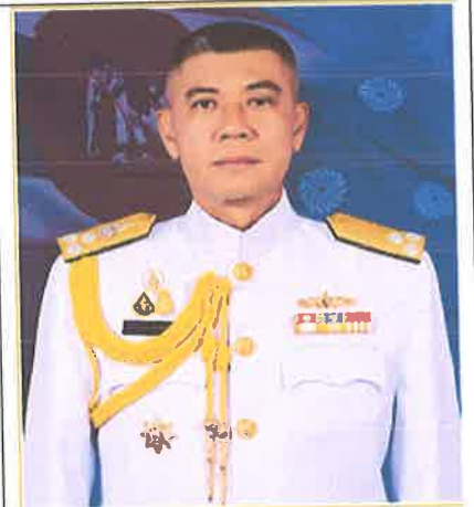
พล.ร.ท.สิทธิพร มาศเกษม ๑ ต.ค.๖๑ ถึง ๓๐ ก.ย.๖๒