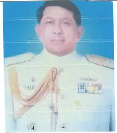
พล.ร.ท.ณรงค์ เทศวิศาล ๑ ต.ค.๕๑ ถึง ๓๐ ก.ย.๕๒