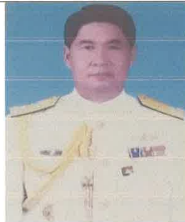
พล.ร.ท.สถิตพันธ์ุ เกยานนท์ ๑ ต.ค.๔๓ ถึง ๓๐ ก.ย.๔๔