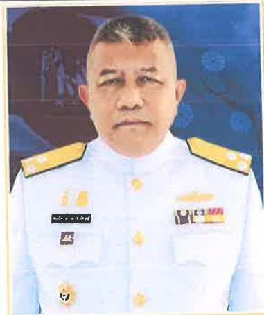
พล.ร.ท.สมนึก เปรมปราโมทย์ ๑ เม.ย.๖๑ ถึง ๓๐ ก.ย.๖๑