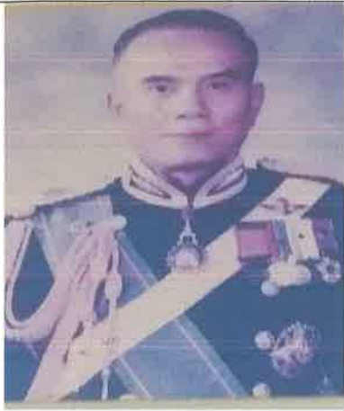
พล.ร.ท.ชวลิต อิศรางกูร ณ อยุธยา ๑ ต.ค.๓๔ ถึง ๓๐ ก.ย.๓๖