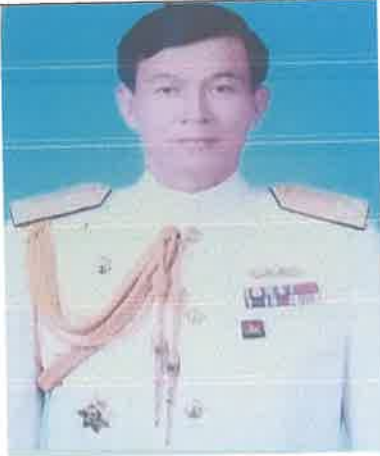
พล.ร.ท.สุพจน์ พฤกษา ๑ ต.ค.๔๙ ถึง ๓๐ ก.ย.๕๑