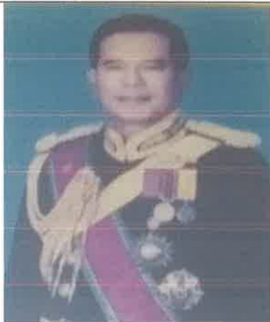
พล.ร.ท.เสนห์ ฉายโหมเลิศ ๑ เม.ย.๔๒ ถึง ๓๐ ก.ย.๔๓