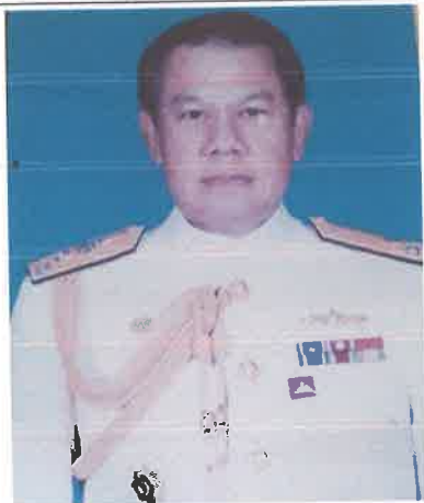
พล.ร.ท.ชูนุ่ม อัจฉริยะ ๑ ต.ค.๕๒ ถึง ๓๐ ก.ย.๕๔