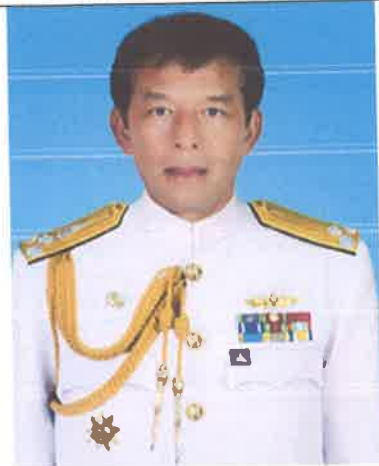
พล.ร.ท.ธราธร ขจิตสุวรรณ ๑ ต.ค.๕๔ ถึง ๓๐ ก.ย.๕๗