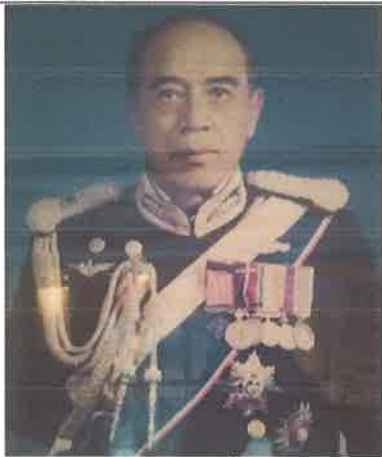
พล.ร.ท.สำราญ อ่ำสำอองค์ ๑ ต.ค.๓๘ ถึง ๓๐ ก.ย.๓๙