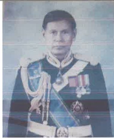
พล.ร.ท.สมบูรณ์ ศรีวรรณารถ ๑๓ ต.ค.๓๖ ถึง ๓๐ ก.ย.๓๗