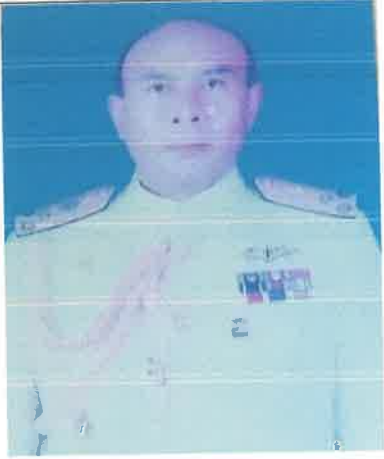
พล.ร.ท.ธนา บุนนาค ๑ ต.ค.๔๗ ถึง ๓๐ ก.ย.๔๙