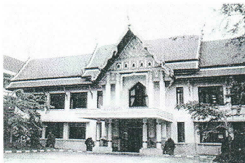
กองบัญชาการกองทัพเรือ

หน้าที่ราชการของหน่วยนี้ได้มีมานานแล้ว พร้อม ๆ กับตั้งกิจการทหารเรือ แต่เรียกชื่อหน่วยเป็นอย่างอื่น และมีหน้าที่ต่าง ๆ กันมาตามยุคสมัย ปรากฏในทำเนียบทหารเรือ พ.ศ.๒๔๔๙ มีนามหน่วยว่า กรมปลัดทัพเรือ กรมปลัดทัพเรือมีปลัดทัพเรือหรือปลัดทูลฉลอง เป็นผู้บังคับบัญชามาจนถึง พ.ศ.๒๔๗๔ ครั้งกระทรวงทหารเรือไปรวมอยู่กับกระทรวงกลาโหม เมื่อ พ.ศ.๒๔๗๕ แล้ว กรมปลัดทัพเรือก็หายไปมีแต่กองบังคับการกองทัพเรือ ขึ้นมาเป็นหน่วยทำหน้าที่แทนจนกระทั่งถึงปี พ.ศ.๒๔๙๖ ทางราชการได้รื้อฟื้นของเดิมโดยตั้งเป็นสำนักงานปลัดทัพเรือ อีกครั้งหนึ่ง ไว้ในอัตรากำลังกองทัพเรือ และได้ใช้ตึกสร้างใหม่ตรงกองบัญชาการโรงเรียนนายเรือเดิมเป็นที่ทำการ